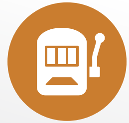
Casinos Virtuales y Juegos de Azar