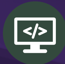
Desarrollo de Software