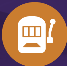
Casinos Virtuales y Juegos de Azar