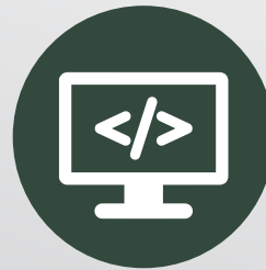
Desarrollo de Software